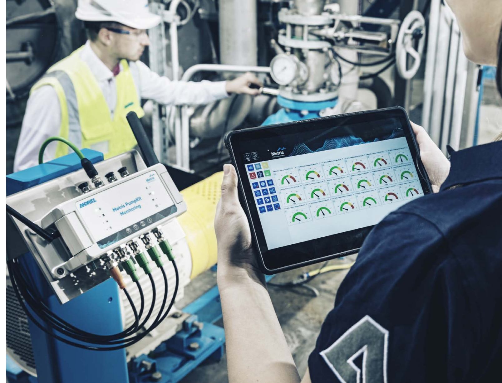
Das PumpKit analysiert automatisch große Datenmengen und liefert klare Auswertungen und Handlungsempfehlungen.

Das Metris PumpKit kann jederzeit an Ihren Pumpen nachgerüstet werden, unabhängig von anderen Sys-